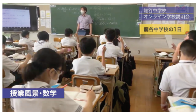
龍谷中学校オンライン学校説明会 動画好評公開中▼